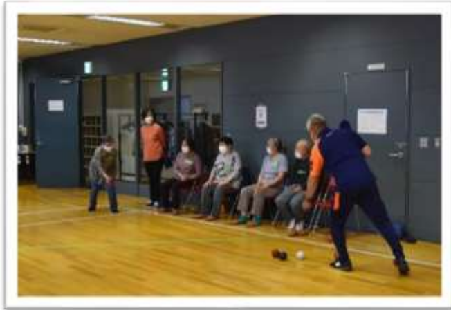
9月28日開催 ボッチャ体験