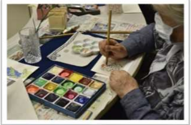
(3点とも) 絵手紙教室

今年度は予定通り教室が開講され、コロナ禍以前のような日々が戻りつつあります。健康運動教室は昨年に引き続き「ボッチャ体験」が開催され、初めて参加する人も含めて楽しく体を動かすことができました。