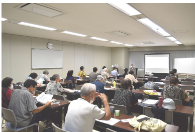
医療・介護クラス