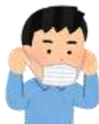
マスクをつけよう