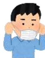
マスクをつけよう